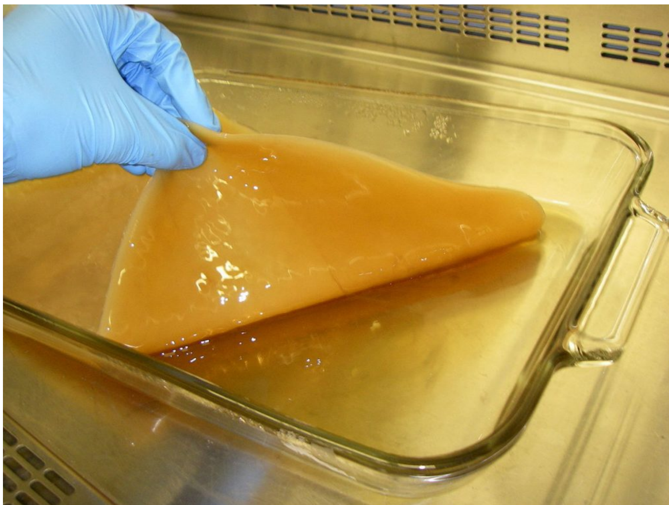
Obr. č.1: Bakteriálna celulóza ( wikipedia )

Je produkovaná aeróbnymi baktériami počas oxidatívnej fermentácie uhlíkového zdroja. Najčastejší zdroj uhlíka, energie, sú sacharidy. Najviac preštudovaný a najúčinnejší výrobca BC je Acetobacter xylinum , ktorý dokáže asimilovať rôzne cukry a poskytuje najvyšší výťažok celulózy. Jej nevýhodou sú vysoké výdavky na drahé médium s len 30 % výťažnosťou produktu. Táto nevýhoda sa ale dá vyriešiť. Ako zdroj sacharidov je možné použiť odpad z poľnohospodárstva bohatý na sacharidy a to kvasinkový odpad pri výrobe piva, zvyšky suchého oleja, šupky z hrozna z vinárskeho priemyslu, výhonky z rastlín, či odpad pri výrobe javorového sirupu. Okrem toho že použitie odpadových látok pozitívne vplýva na výrobu BC, taktiež znižuje environmentálne problémy súvisiace s likvidáciou odpadu.