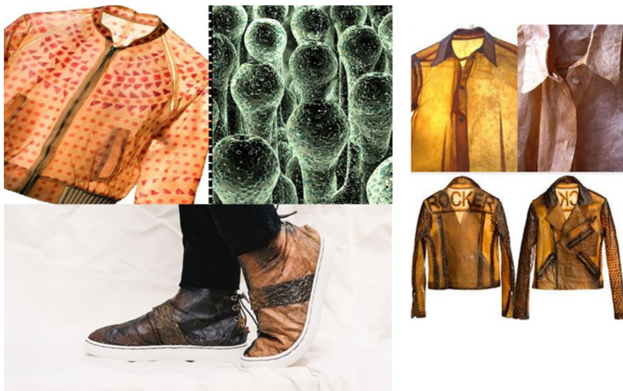
Obr. č.4: Oblečenie z bakteriálnej celulóza

Na jej výrobu stačí len správny zdroj sacharidov a dusíka. Môže na to byť použité kokosové mlieko, substrát zo zeleného čaju či čierneho čaju, kvasničný extrakt a to všetko za prídavku zdroja sacharidov. Vyrobená textília je tenká, jemná, ohybná, ale zároveň drží tvar a je odolná voči mechanickému poškodeniu. Neobsahuje žiadne toxické látky ani alergiu vyvolávajúce látky. Okrem iného, keď je BC správne vyrobená, je možné z nej vyrobiť takmer akýkoľvek typ oblečenia. Farba BC závisí od použitého substrátu: čierny čaj - svetlo hnedá, červený čaj - ružovkastá, zelený čaj - béžová, kokosové mlieko - priesvitná až biela.